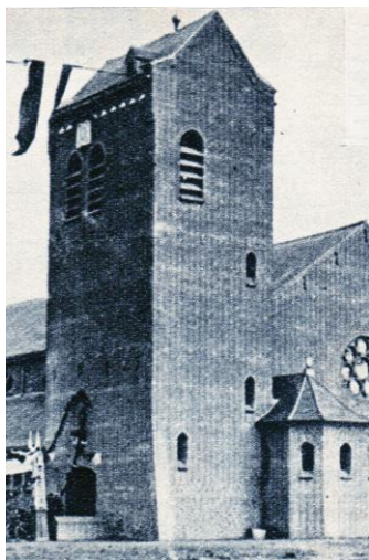
Toren van de in september 1944 verwoeste kerk van Breedeweg, gebouwd in 1935,