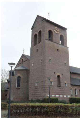
Toren van de kerk van Breedeweg