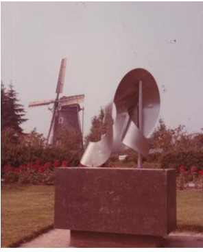
Paar jaar na onthulling