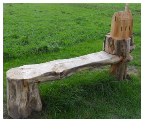
Bankje bij informatiepaneel