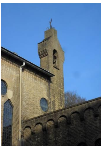
Klokkentoren Kapel Mariëndaal