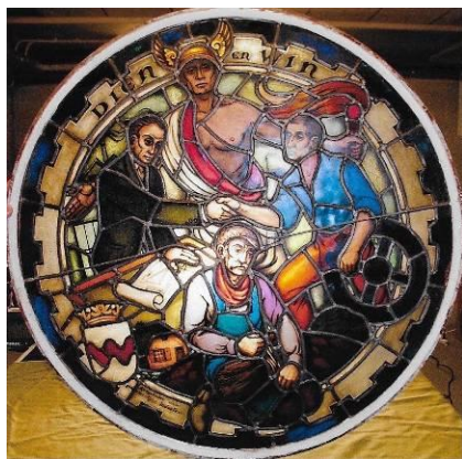
raam in toenmalige raadszaal