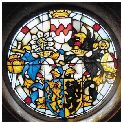
raam hal op de verdieping